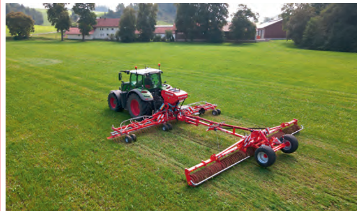
Der Güttler GreenMaster 600 Breitsaat mit Mayor 640 Prismenwalze für die perfekte Grünlandpflege, schmackhaftes gesundes Futter für hohe Leistung und gesunde, langlebige Kühe, eine große Pflanzenvielfalt durch professionelle Nachsaat der standortgerechten Sorten. Mit dem Gutschein für ein Profitraining schöpfen Sie das komplette Potential Ihres Grünlands aus und arbeiten gleichzeitig sehr viel nachhaltiger.